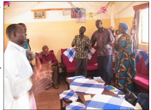
Lobpreis beim Treffen der Leiter von drei Burning Heart Gemeinschaften in Soroti

Aus einer schlaflosen Nacht sind inzwischen mehrere Gemeinschaften mit guter und engagierter Leiterschaft entstanden, die uns auf weiteres Wachstum hoffen lassen