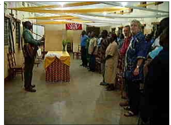
Lobpreis vor Beginn des Vortrags