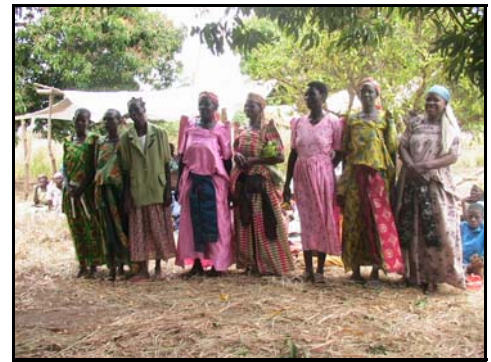
Eine Gruppe von Witwen aus Serere stellt sich vor