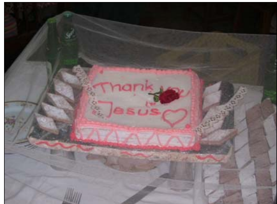
Torte für das Abschlussfest