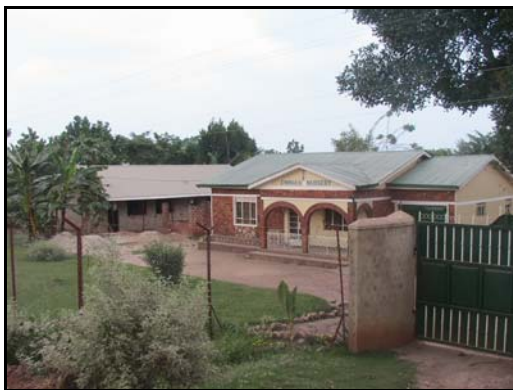
Katikamu: Emmaus Schule