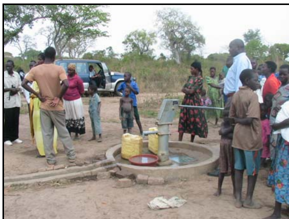
ORIDA: die Bezirkspolitiker besichtigen den neuen Brunnen