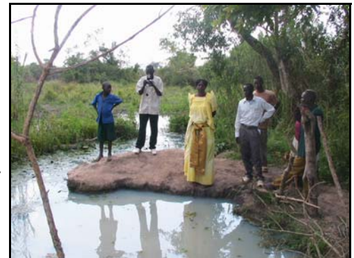
Die Bezirkspolitikerin vor der alten Wasserstelle am Rande des Sumpfes